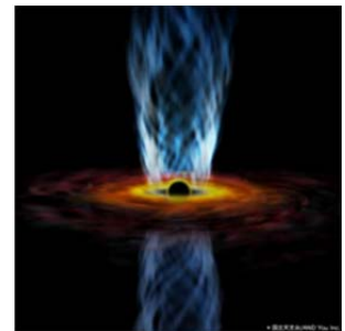
図 2：ブラックホールの想像図