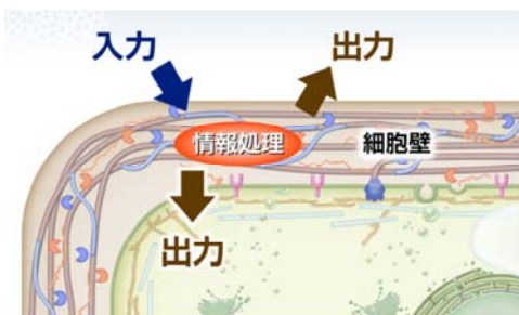
図1 細胞壁内における情報処理の概念図

中枢神経系による一元的な個体統御を行う後生動物とは対照的に、植物は、各細胞が高い自律応答性を維持し、それらの総体として個体全体を統御するシステムを進化させてきた。この統御系は、発生や生体防御など、植物の生命過程の基盤となる重要な過程であるが、その分子機構は未解明である。本領域では、これらの過程が植物固有の細胞外構造である細胞壁およびその近傍、すなわちアポプラストにおける情報処理を介して進む点に着目し、この過程を「植物細胞壁の情報処理システム」として捉え、包括的に分子解剖し、植物固有の新しい情報システムの解明を目指す。これにより、解明への糸口すら得られなかった植物固有の高次機能の分子基盤の解明を目指す。