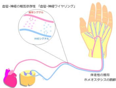
図 1. 血管ネットワークと神経ネットワークの相互作用はどのようにして出来上がるのか？

脊椎動物は、体の隅々にまで血管網や神経網を発達させることにより、複雑な高次機能の獲得とその情報処理とを可能にしてきた。これらの血管-神経2大ネットワークが形成されるとき、両ネットワークの間には、密接な相互作用（「血管-神経ワイヤリング」）が存在する。両者の機能的ワイヤリングは、血管-神経の明瞭な密着性や、その密着性によるホメオスタシスの調節などからもわかるように、生体機能の根幹を支える基盤として位置づけられ、その重要性は主に臨床の現場において古くから認識されてきた。しかしながら、血管-神経ワイヤリングの成り立ちのしくみは、現代生命科学においてはほとんど理解されていない。本領域においては、血管-神経ワイヤリングの理解に向けて、両者間で働く相互作用とそれを制御する細胞ダイナミズム、そしてこれら相互作用の分子実体に焦点を当て、そのしくみを解き明かす。