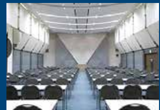
幕張メッセ国際会議場