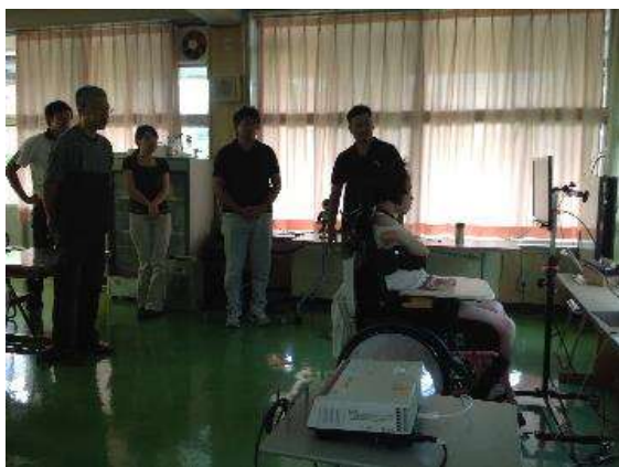
写真 3-11-1 視線入力デモの様子

平成 29 年度に初めて開講したため、事前の案内が十分でなく、障害のある当事者の参加者が少なかったことは課題である。卒業生を含め、多くの人に参加してもらえるような内容を企画し、毎年実施していけるようにしたい。