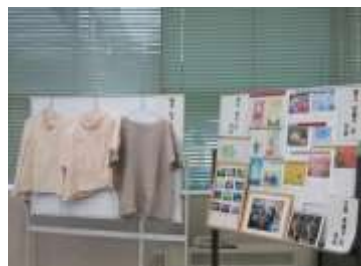
写真3-3-2 作品展示の様子