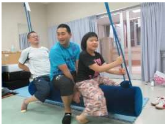
写真3-10-1 感覚運動学習班の活動の様子

実施後の評価に関して、現在は障害のある当事者に対してはアンケートを行っていない。今後は、当事者の意見も踏まえ、プログラムの内容や方針を検討していきたいと考えている。