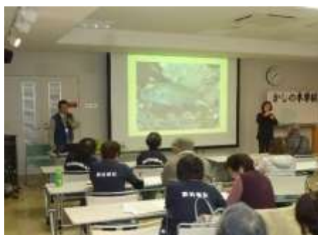
写真3-6-1 「かしの木学級」の様子1

「かしの木学級」は健聴者向けのスライドがそのまま使用されているという現状がある。難聴者にとってのスライドは「要約筆記」ではないということが、外部講師には理解されないということがある。1つのスライドに出せる文字数が一定数を超えると、障害者の集中力を超えてしまう。学外講座でも、健聴者向けのミュージアムツアーガイドをそのまま行うのではなく、その説明も工夫が必要であることが課題となっている。