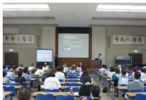
写真3-6-2 「かしの木学級」の様子2