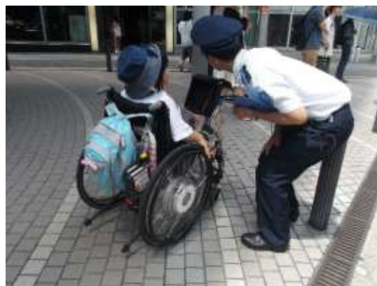
写真3-10-2 コーデ Wish 班の活動の様子